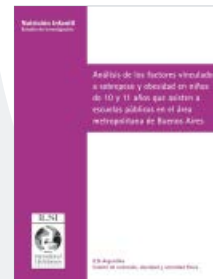
Análisis de los factores vinculados a sobrepeso y obesidad en niños de 10 y 11 años...