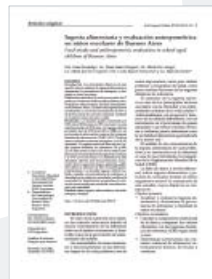
Ingesta Alimentaria y Evaluación Antropométrica en niños escolares de Buenos Aires