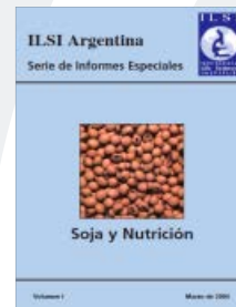
Soja y Nutrición Informe Especial