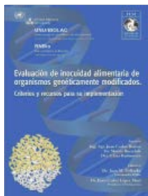
Evaluación de inocuidad alimentaria de OGMs. Criterios y recursos para su implementación