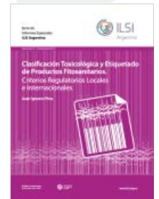
Clasificación toxicológica y etiquetado de productos fitosanitarios